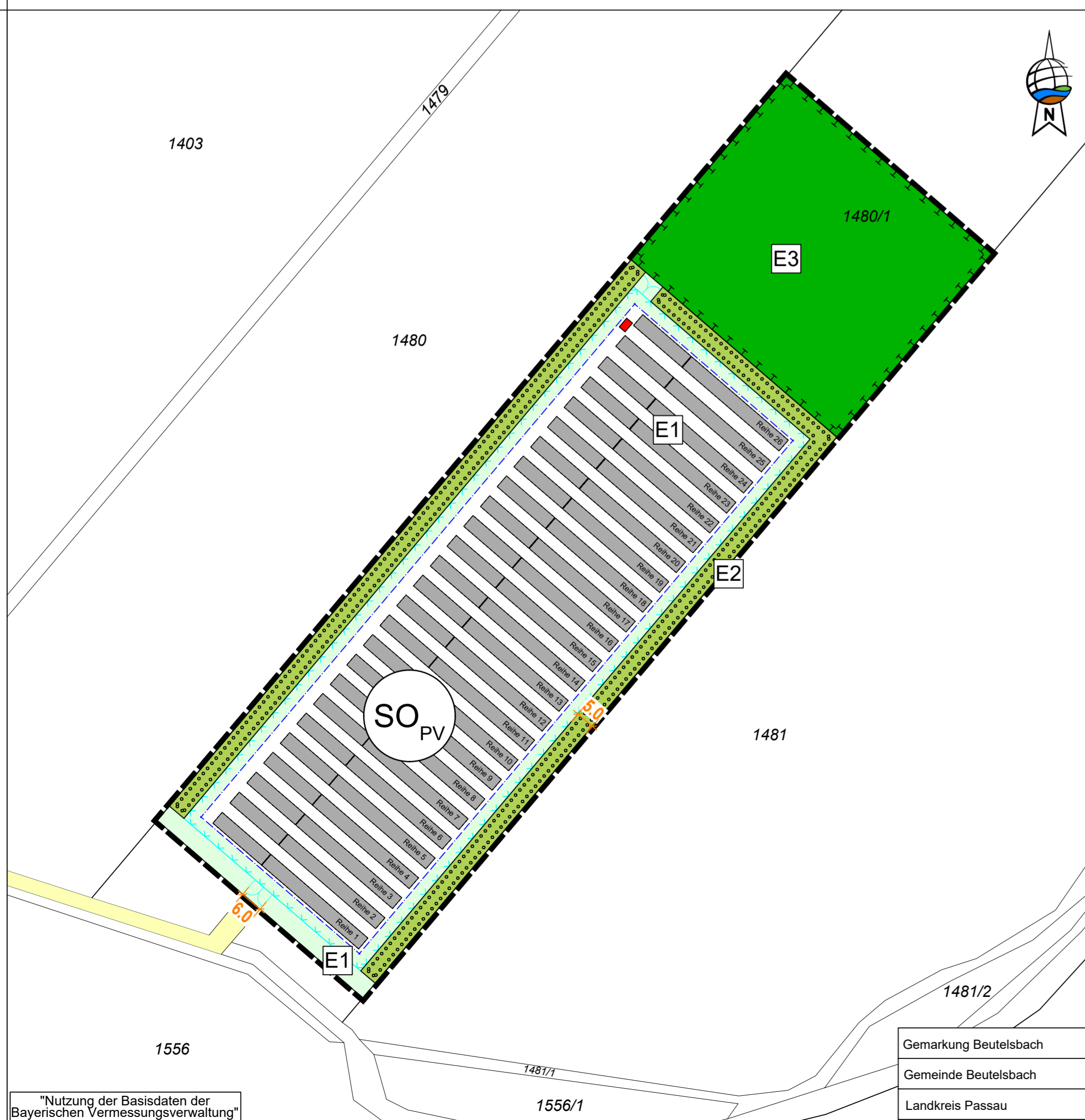
*Nutzung der Basisdaten der Bayerischen Vermessungsverwaltung